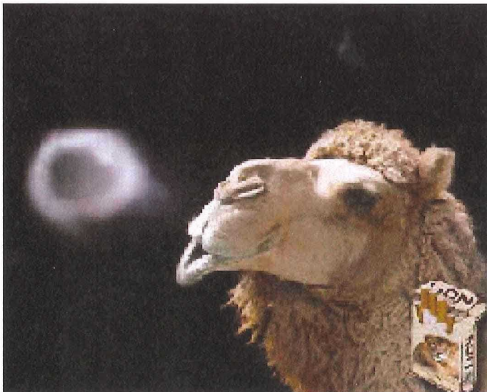
Boven en Links; reclame voor het rookgenot.