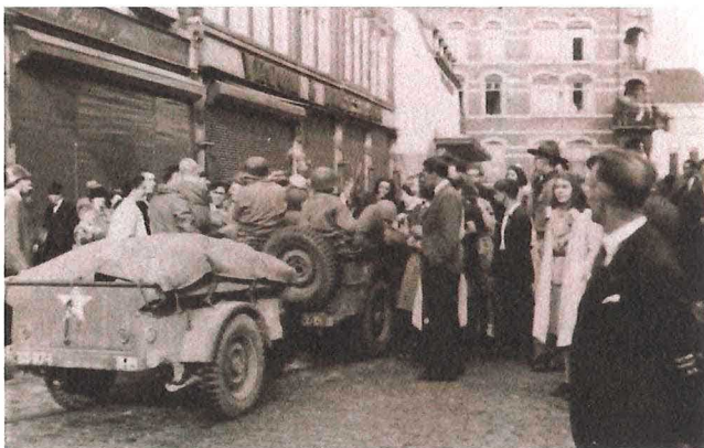
Boven; Geleenstraat, op de achtergrond het Canterhuis.