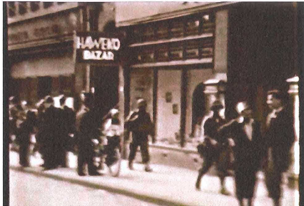
Boven; Geleenstraat. Haweco bazaar van ter Poel.