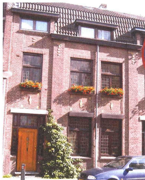
Geboortehuis van de schrijver. Lindeplein 28

We liepen de straat uit naar de Bekkerweg en daarna richting het "Rood Truid" hoek Nobelstraat Kruisstraat. Midden op het kruispunt stond een Amerikaanse tank vol geladen met mensen, mannen, vrouwen en jeugd.