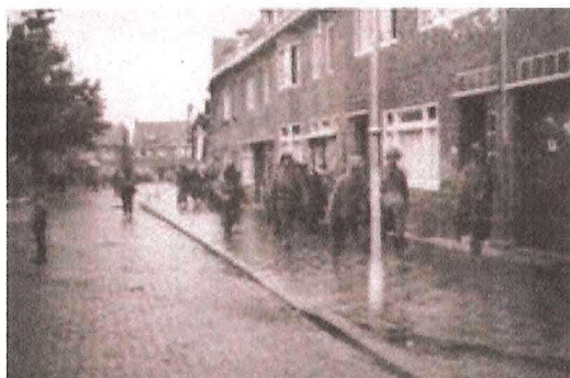
Onder: de eerste Amerikanen in de Dr. Jaegerstraat, zondag 17 sept. 1944

De tank was nauwelijks weg of er sloeg een granaat in de zijgevel van de bloemenzaak Erven (hoek Benzenraderweg – Bekkerweg). Een granaatscherf treft het koelapparaat van bakker Pelt aan de overkant.